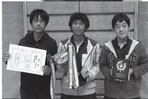
中学生優勝 団子三兄弟