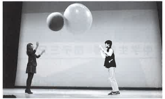
講師 東京大学サイエンスコミュニケーションサークル「CAST」のみなさん

この事業は、市PTA連合会・市青少年育成推進員協議会・教育委員会との共催で行われ、親子で科学の楽しさにふれることを目的としています。参加者と会場が一体となったの大規模なショーや、実験キットを用いて空気の不思議を再発見しました。2回公演で600名近い方に参加していただき、大盛況のショーとなりました。