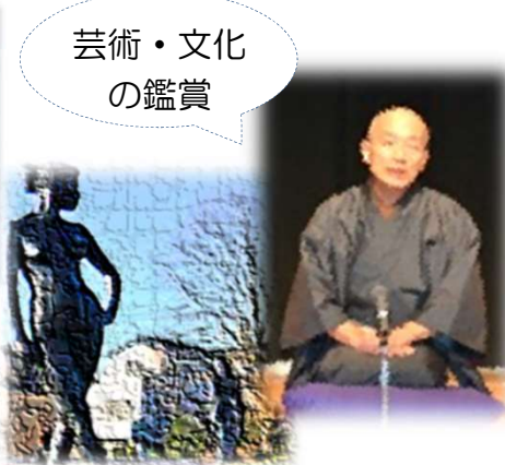
芸術・文化 の鑑賞