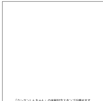
「クレヨンしんちゃん」の来館記念スタンプが押せます

漫画「クレヨンしんちゃん」の複製原画や映画ポスターなどが展示されています。 開9:00~16:30 月曜(月曜が祝日の場合はその翌日)、年末年始