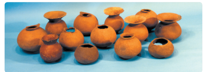
権現山遺跡方形周溝墓出土底部穿孔土器