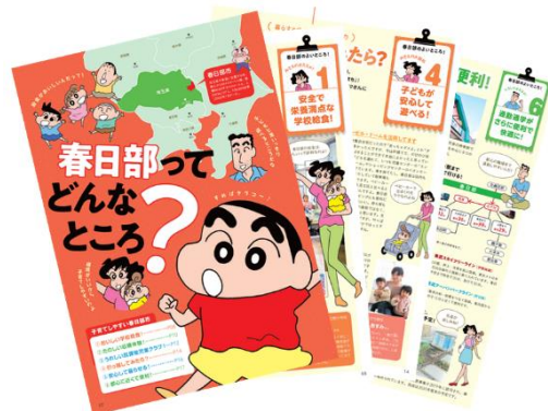
▲子育て情報が盛りだくさん！