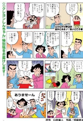
▲巻頭には描きおろしの漫画を掲載