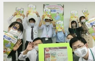
▲市職員もさまざまな方法でPR

今回のアワードの読者投票部門の受賞を目指して、市内の事業者やかすかべ親善大使の皆さん、春日部の魅力を発信する活動を行っている「かすかべ+1サポーター」の皆さんにも春日部マガジンを周知するとともに、投票のご案内や、投票周知の協力をお願いに行ってきました。