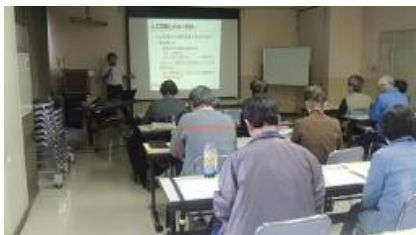
身近なところにあるコンピュータと人工知能(2018年度実施)