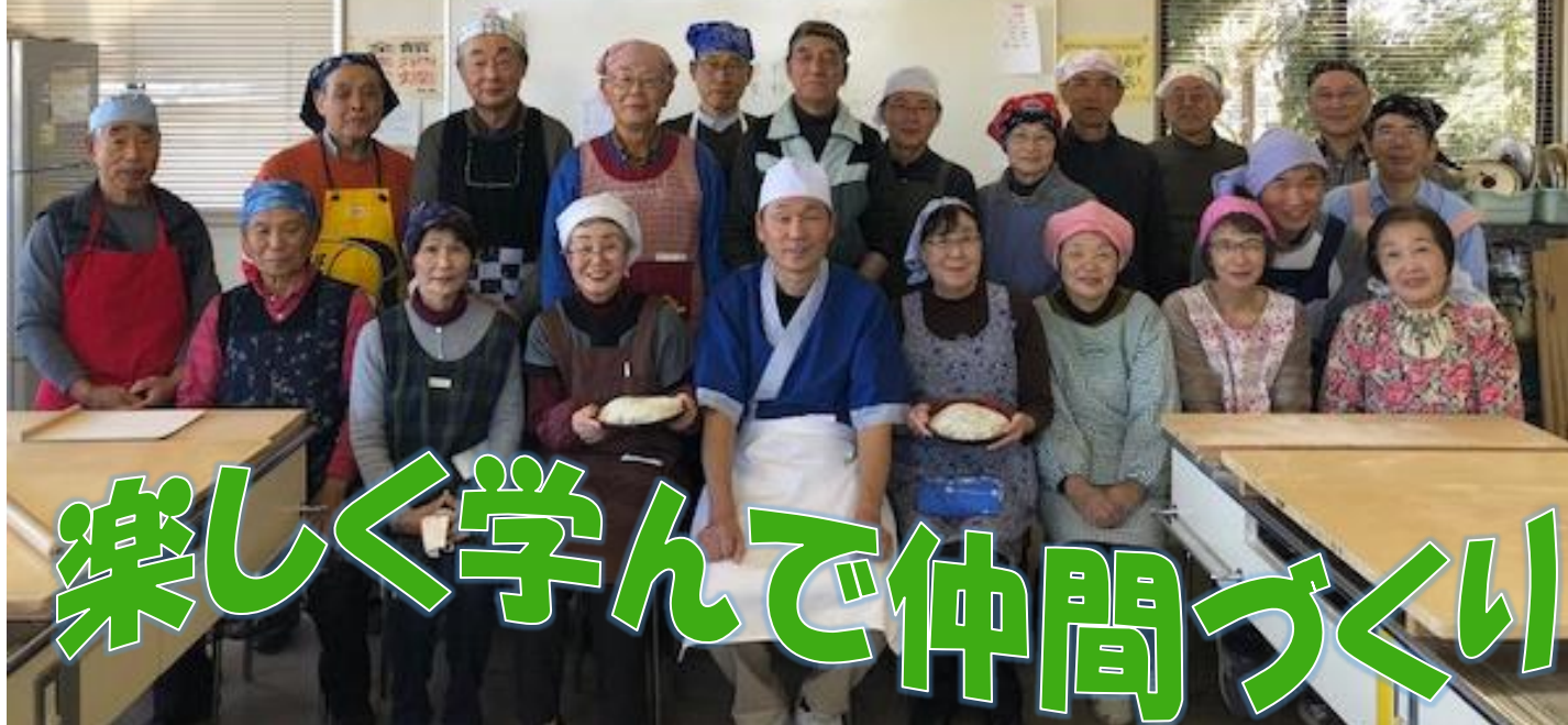
授業風景(そば打ち体験)

【日 程】2019年5月10日～2020年1月31日(全30講座) 原則、金曜日13時30分～15時30分の2時間 講座終了後に30分程度のホームルームあり