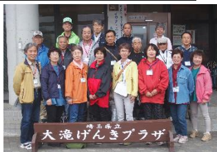
宿泊体験(林業体験と七宝焼き)(2018年度実施)