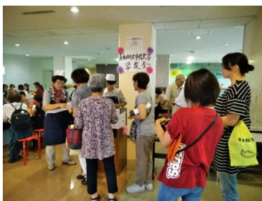
2018 庄和地区公民館まつり「市民カフェ」