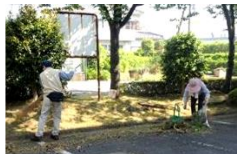
庄和地区公民館清掃活動