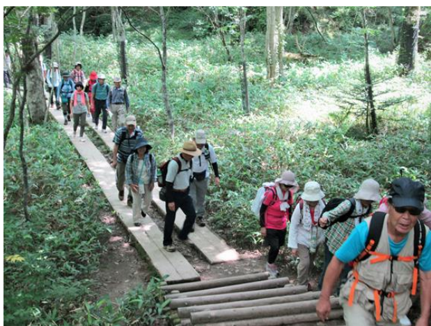
木道を進む長い行列

はじめてのハイキングの参加で体力に不安がありました。2 時間 40 分歩けるかと心配になり、朝、夕 30 分ずつ歩くことにしました。当日暑い日でしたが、標高 1400m からの下りでした。湯滝の豪快なしぶきに暑さも忘れ、木々の影の中、湿原には木の歩道でしたので、歩きやすく、すぐ傍には湯川が流れ涼しく感じ、途中には小さな滝もありました。