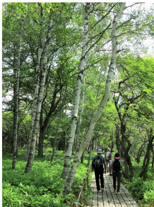
白樺の林を抜ける

アザミ、ワタスゲなどの植物や、かもの親子の水浴びを見たりしながら、最終の龍頭の滝まで 15,600 歩でした。無事到着しホッとしました。