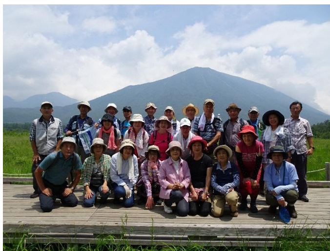
戦場ヶ原で全員集合