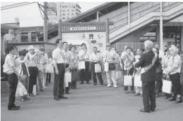
社会を明るくする運動の啓発活動

さいたま保護観察所 就労支援担当 TEL 048-861-8287 FAX 048-836-1373