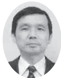
さいたま保護観察所