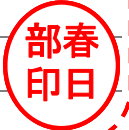
申請業務、申請自治体