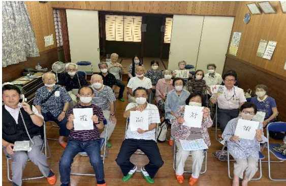
いきいきクラブすこやか会（7月19日） 特殊詐欺や訪問販売といった実際に発生している事例を紹介しながら、様々な手口や対処法に関する講義を行いました。「～電話対策～」