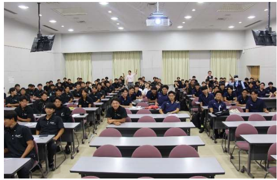
共栄大学（9月8日・11日・12日） 闇バイトや消費者被害を予防するため、具体的な事案を紹介しながら、危険性や被害・対処法についての講義を行いました。