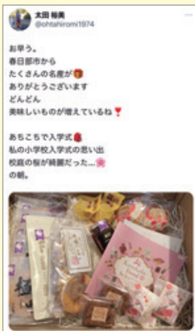
▲ 太田 裕美 @ohtahiromi1974