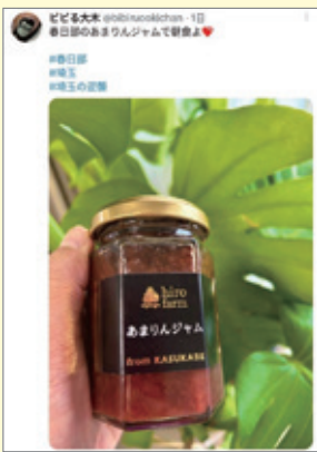
▲ ビビる大木 @bibiruoookichan