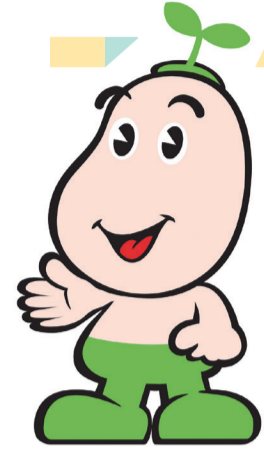
国保マスコット 健康まもるくん