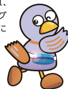
埼玉県マスコット「コバトン」▶