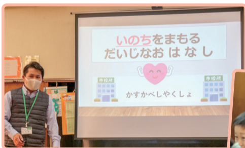
詳細・登録は市で▶