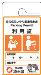
妊産婦、 けが人等用

利用証は、障害者手帳、難病関係受給者証、介護保険被保険者証、母子健康手帳などをお持ちの方のうち、交付基準を満たす方が交付を受けることができます。交付基準の詳細については県ホームページをご覧ください。