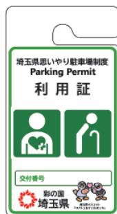
その他の高齢者、 障害者等用