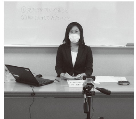
ライブ配信撮影の様子

なお、この講演会は、コロナ禍における新しい生活様式を実践するため、当市民会議では初の試みであるオンライン（YouTubeライブ配信）で行いました。