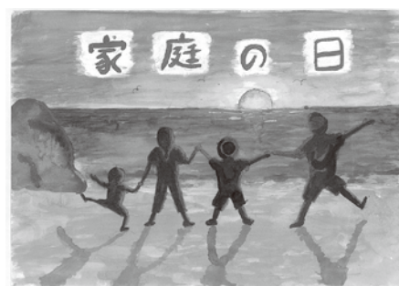
【優秀賞】 「遊びの終り」 中野小 5年 高波 柊哉