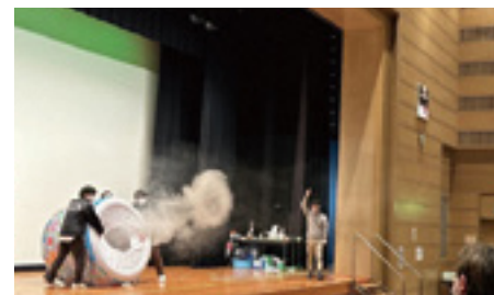
空気砲の実験の様子

この事業は、親子の体験活動の機会の創出を目的に、春日部市青少年育成推進員協議会・春日部市PTA連合会・春日部法人会と連携し、春日部市教育委員会と共催で行っています。