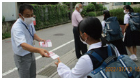
キャンペーン活動の様子

ネット上での誹謗中傷などの被害・トラブルの際は、一人で悩まず家族や先生に相談してください。相談窓口も開設されています。