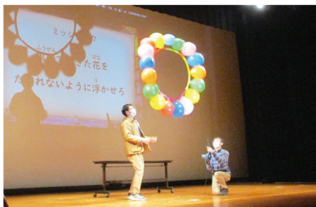
風船の実験の様子

東京大学サイエンスコミュニケーションサークルCASTの皆さんをお迎えし、「親子サイエンスショー～親子で体感！回転のふしぎ～」を開催しました。