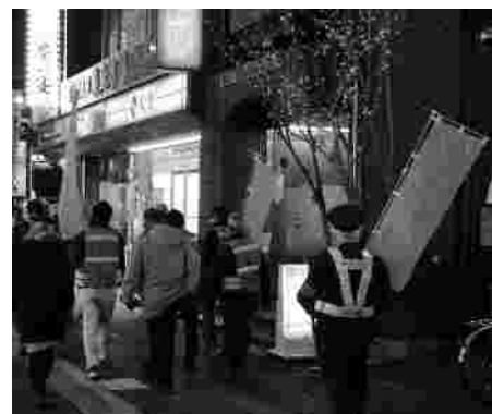
路上喫煙防止の巡視の様子