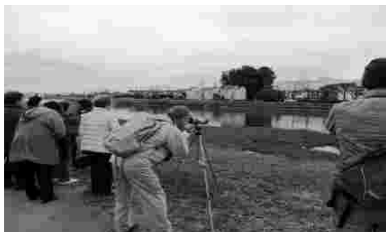
自然観察会の様子