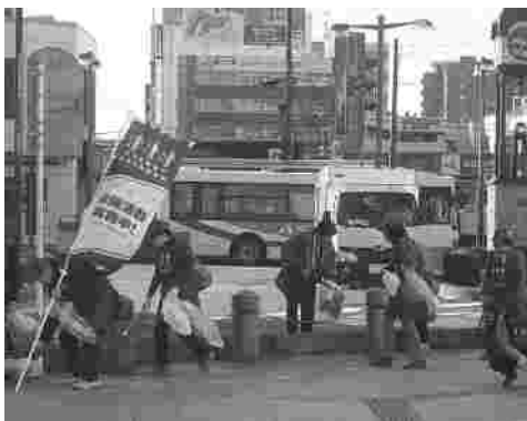
環境美化活動の様子