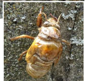
セミの幼虫は地中で数年過ごし、夏の夕 方、雨が降らない日を選んで地上に出て くる。近くの木などに登り、羽化する。