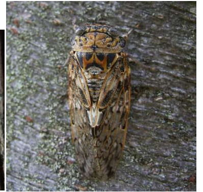
一番早く出てくるのはニイニゼミ 小型のセミで、抜け殻は丸っこく、泥が付いている