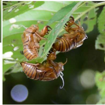
鳴き声が特徴的なツクツクボウシ 抜け殻は小さく白っぽい