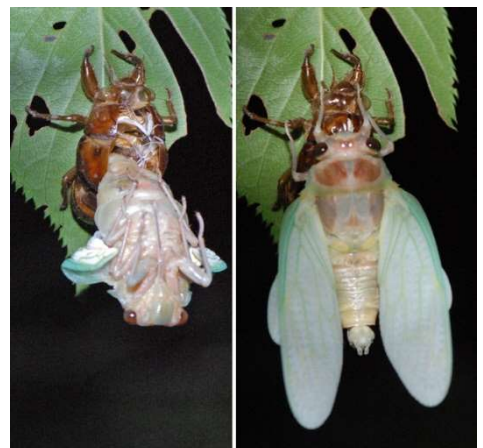
→ アブラゼミの羽化 背中が割れてのけ ぞって出てくる。 全身が出ると殻に つかまり、羽を伸 ばして朝まで待つ