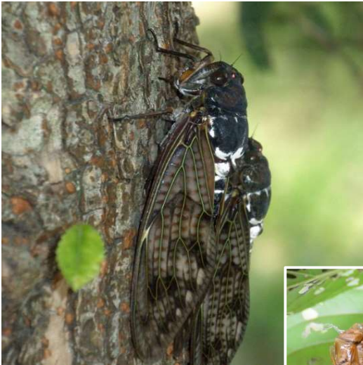
一番多くみられるアブラゼミ。 羽が茶色く、ジリジリと鳴く 枝の先まで行って羽化する