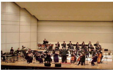
④春日部フィルハーモニー管弦楽団が活躍

2010年に始まった「かすかべ音楽祭」は、春日部の街全体が音楽で彩られる音楽の祭典。こどもから大人まで多くの市民に根づく音楽文化を育むとともに、春日部市にゆかりのある音楽家や音楽団体の素晴らしい演奏が楽しめるイベントだ。