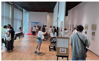
④多くの人がイラストを楽しみに訪れた

2013年4月から春日部市が販売している「クレヨンしんちゃん絵はがきセット」第1弾から第3弾まで、全14種類のイラストを展示。イラストには「まちの案内人」として活躍する「クレヨンしんちゃん」のキャラクターや市内の風景が描かれている。