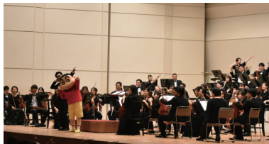
④「クレヨンしんちゃん」の楽曲も演奏した(©臼井儀人/双葉社・シンエイ・テレビ朝日・ADK)

親子で楽しめるなじみ深い音楽を、春日部フィルハーモニー管弦楽団の演奏で届ける音楽祭。演奏に合わせてみんなで歌ったり踊ったりするコーナーのほか、「クレヨンしんちゃん」の野原しんのすけくんがゲストとして登場するなど盛り上がった。