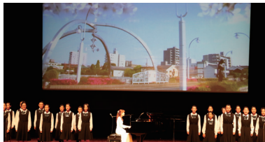
④ナターシャ・グジーコンサートの開催を予定(写真は10周年記念式典のもの)

2005年10月1日に旧春日部市と旧庄和町が合併し、新たな春日部市としてスタートしてから20年。これまで市の発展に尽力していただいた市民の方々に顕彰するために、式典に先立って表彰式を実施する。