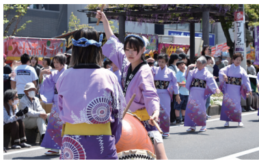
④各会場では流し踊り、和太鼓、キッズダンス、よさこいソーランなどが行われ、見どころ満載。模擬店も多数出店した

日本最大級の長さを誇る藤棚が続く「ふじ通り」で開催される春日部藤まつりは、市民と観光客が安全かつ安心に楽しめる市民の手づくりの祭り。2025年は「クレヨンしんちゃん」の野原一家の皆さんも登場し、大いに盛り上がった。