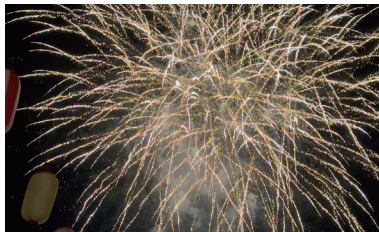
④「春日部大風花火大会」のフィナーレを飾る打ち上げ花火④スターメインや小型煙火が春日部の夜空を彩る

1986年に始まった旧庄町の「町民夏まつり」を継承して今も市民に親しまれている花火大会を、2025年からは「春日部コミュニティ夏まつり」も統合して開催。1,900発の花火とキッズダンス、よさこいソーラン、和太鼓演奏なども披露された。図レジデンシャルパークSHOWA(庄和総合公園) ☎048-736-1127(まつりの部/春日部市コミュニティ推進協議会)、048-746-0611(花火の部/春日部大風花火大会実行委員会) ☎15:30~21:00 図なし 図366台 図南桜井駅北口より徒歩20分