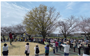
④交流も楽しめる④インストラクターによる準備体操、ウォーキングアドバイス後に開始

春の心地よい風を感じながら古利根川沿いの桜並木を歩く。コースは桜咲くマルシェがゴールとなる「しっかりコース(3.7km)」と、エンゼル・ドーム前広場がゴールとなる「親子コース(1.0km)」とがあり、幅広い世代が楽しめる。