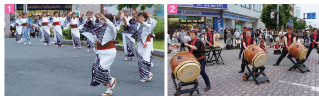
①春日部駅東口前で実施された流し踊り②和太鼓競演では、太鼓の圧倒的な音量と迫力で会場が熱気に包まれた③18:00にスタートした大人御輿パレード。20数基の御輿が通りを練り歩き、迫力たっぷり

大風がフワッと大空に舞いあがった瞬間は、圧巻の眺めで感激！ほかに小風や企業名入りのコマーシャル風などが次から次へとあがるので、飽きることなく空を眺めていました。