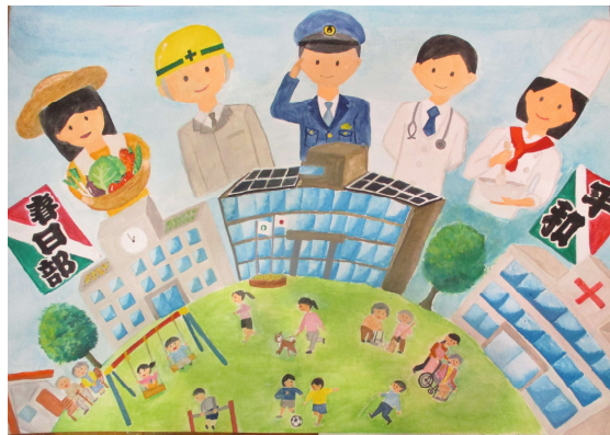
「笑顔があふれる春日部市」 武里中 古橋 瑠香