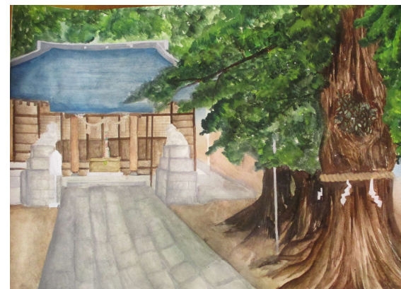
「夏の東寺」 大沼中 郷古 彩加