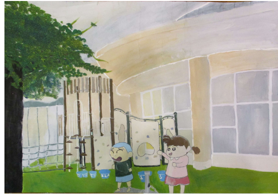
「エンゼルドーム・想ひ出一つ」 武里中 寺下美琴