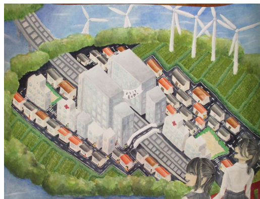
「川にかこまれた春日部」 江戸川小中 赤見 陽