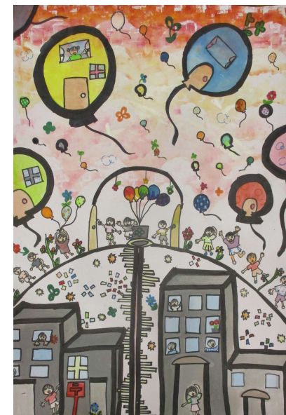
「風せんの町」 幸松小 李雅楠