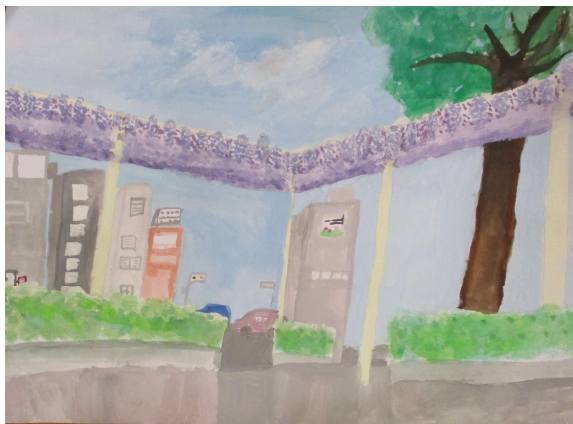
「未来へ続く藤の花」 緑小 植竹穂華