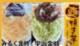
かさ水・春焼き芋