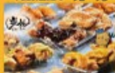
唐揚げ・ワッフル・ドリンク