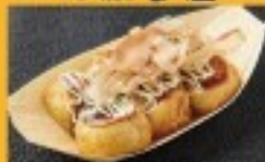
たこ焼き・たこ飯・チュロス