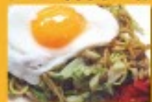
横手やきそば・クラフトビール