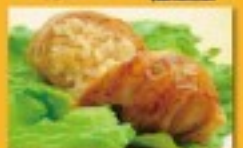
肉巻きむすび・牛串・アルコール