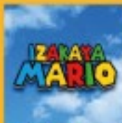
チキンピリヤニ・ナンカレー