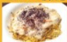
鴨串・あんかけ焼きそば