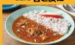
カレー・コーヒー