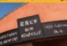
砂糖コンフィ・パスタフリット