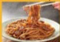
焼きそば・アルコール