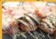
たこ焼き・唐揚げ