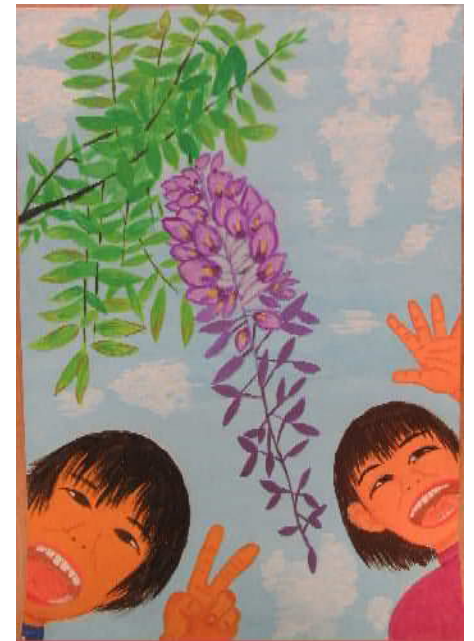
「ふじの花と記念撮影」