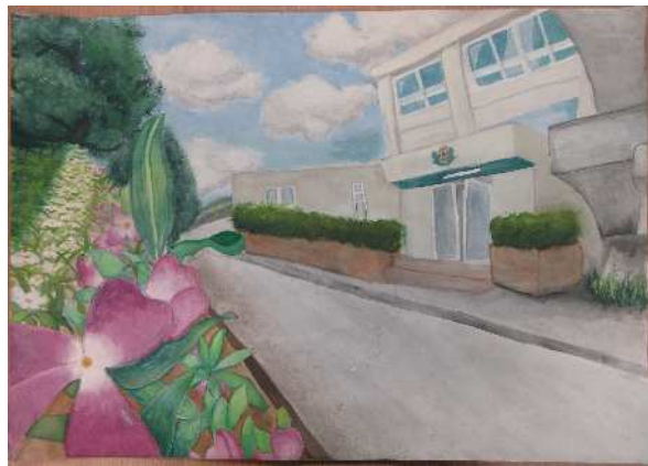
「三年間」豊春中 春日 星海