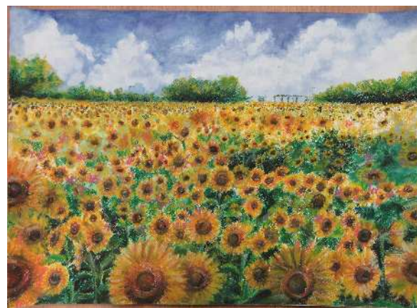
「表情豊かなひまわり達」 葛飾中 大竹 陽向