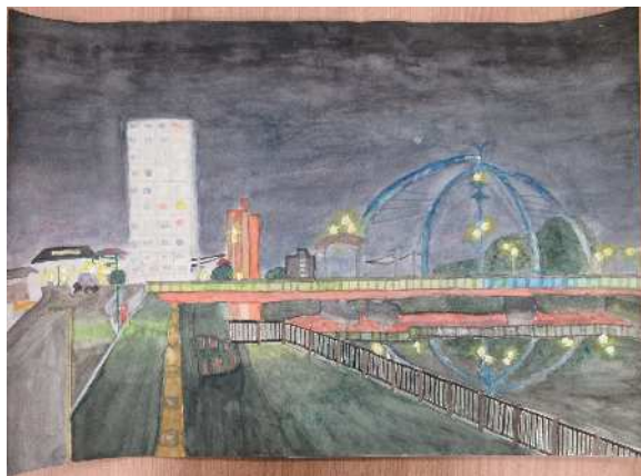
「春日部の光」豊春中 沼澤 陸空