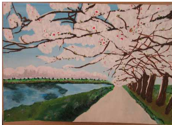
「大切な場所」大沼中 永原 美南