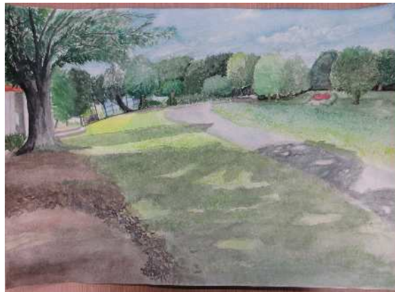
「あたたかい公園」葛飾中 新藤 つかさ