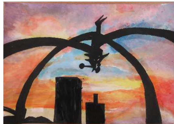
「よく行った場所」武里中 田端 康成