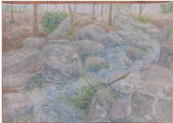
「いつまでも残る思い出」葛飾中 八木 優