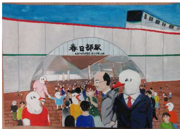
「くるかもしれない未来」 飯沼中 染谷 天鯉