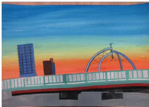
「古利根公園」武里中 屋代 梓