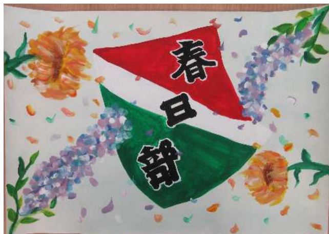
「春日部の伝統」飯沼中 古谷 奏菜