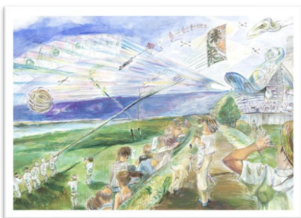
「時代は変わっても・・・」 江戸川小中 匿名希望