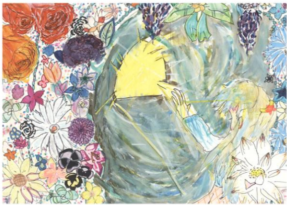
「春日部の光りかがやく未来に向かって」