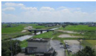
※7月21日時点 環境センターより南方向撮影

発行日：令和3年8月 発行元：春日部市役所まちづくり推進課 産業基盤整備担当 048-736-1111（内線3578）