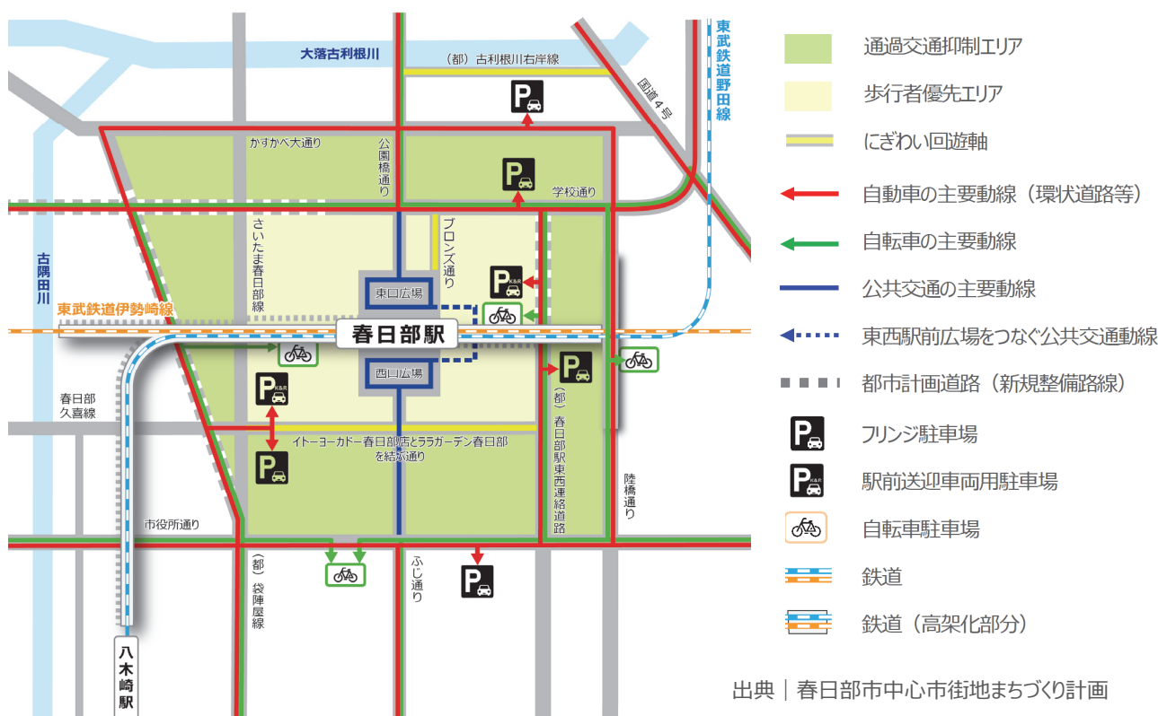
■ 図31 | 「人主役」の交通環境整備に向けた方針図