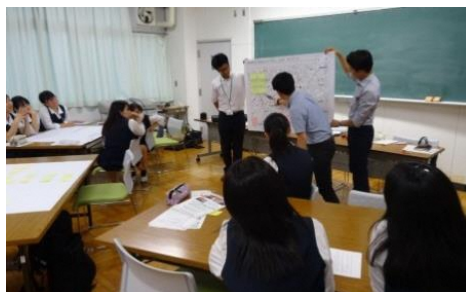
春日部女子 高校生徒との 意見交換