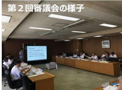
第2回審議会の様子