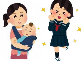
▲子育てママ・パパ