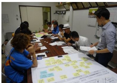
消防団の方々と の意見交換