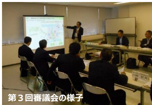
第3回審議会の様子