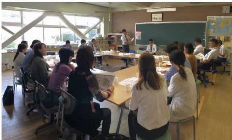
春日部中学校PTAの方々との意見交換会（参加者19名うち教職員3名）