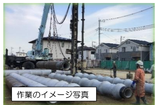
作業のイメージ写真

杭工事はHyperストリート工法という、騒音・振動が少ない工法を用いて行います。本工事では杭挿入部の掘削を行い、掘削機の引抜きに合わせ、杭固定液を注入します。掘削及び杭固定液の注入完了後、1か所に杭を5本つなぎながら43mまで挿入します。工事中は、土・埃等が飛ぶ可能性がありますのでシートを張り飛散防止対策を行います。騒音・振動については、低騒音型を使用又、重機の移動の際には、低速度などの対策をとりながら作業を行います。