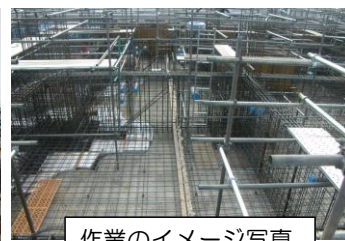
作業のイメージ写真

基礎の位置を出すために圧送車でコンクリートを打つ作業を行います。コンクリートを運搬する車が多く出入りします。