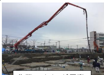
作業のイメージ写真