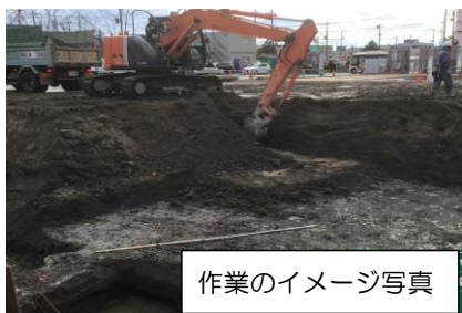
作業のイメージ写真