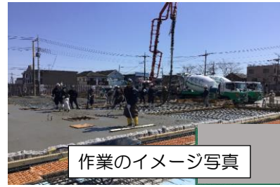
作業のイメージ写真

型枠工事は床のコンクリートを受けるために板材を貼る作業です。鉄筋工事は床を強固にするために鉄筋材を格子状に組む作業です。