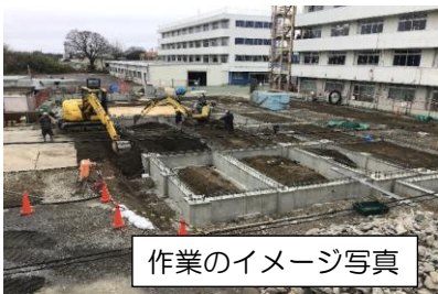
作業のイメージ写真