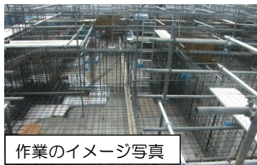
作業のイメージ写真