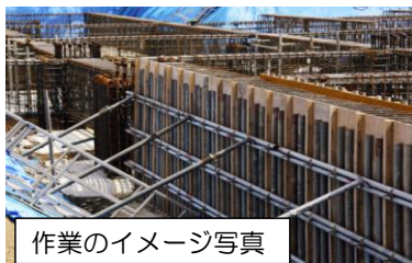
作業のイメージ写真