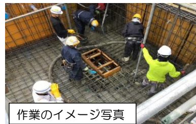
作業のイメージ写真

土台となる建物の基礎の形状を作るため、型材を組み立てる作業です。型材で土台の骨組となる鉄筋を囲っていきます。