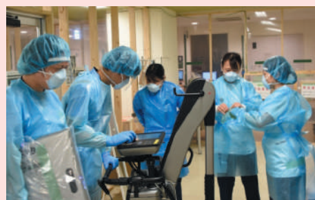
感染者の病室に入る準備をするスタッフ

市民の皆さんは、ぜひ感染症予防対策の基本に立ち戻り、緩んでしまいそうな気持ちや行動を引き締めてくださいますよう、医療の現場からお願いします。