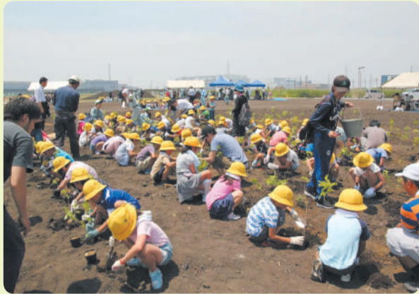
▲令和元年5/27に開催した植樹イベント

問い合わせ/公園緑地課(内線7094)、埼玉県公園スタジアム課(☎830-5408)