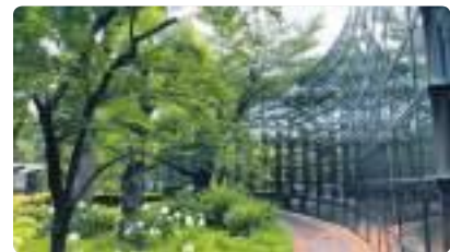
▲春日部市立中央図書館(令和3年)