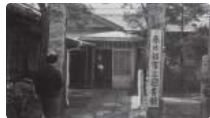
▲春日部市立春日部図書館(昭和43年)