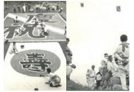
▲昭和34年の文字書き、大風飛揚

5/17(火)~7/3(日) 郷土資料館 宝珠花地区と大風あげの歴史・文化を紹介 同館(TEL)763-2455)