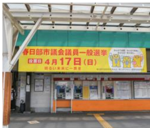
▲選挙PR看板(春日部駅西口改札前)