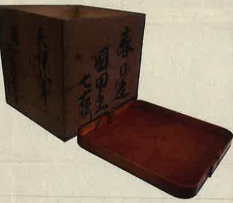
くぶ はたごや くになや 巡幸の供奉者が昼食をとった旅籠屋国田屋の吸物膳と箱(豊島区立鈴木信太郎記念館蔵)

本展は、宮内庁宮内公文書館所蔵の公文書と、郷土春日部ゆかりの資料のコラボレーション展示です。今回初めて公開される資料などの展示を通じて、近代の皇室と春日部・埼玉県東部の歴史について紹介します。また、関連イベントや近隣市町との連携展示「埼玉県東部と近代の皇室」も開催します。あわせてお楽しみください。