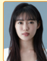
やまぐち ののか 山口 乃々華さん (女優)