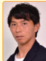
さとう ひさと 佐藤 寿人さん (元プロサッカー選手)