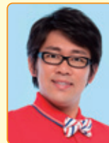
おおき びびる大木さん (お笑いタレント)