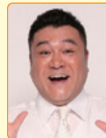
やまざき ひろなり 山崎 弘也さん (お笑い芸人)