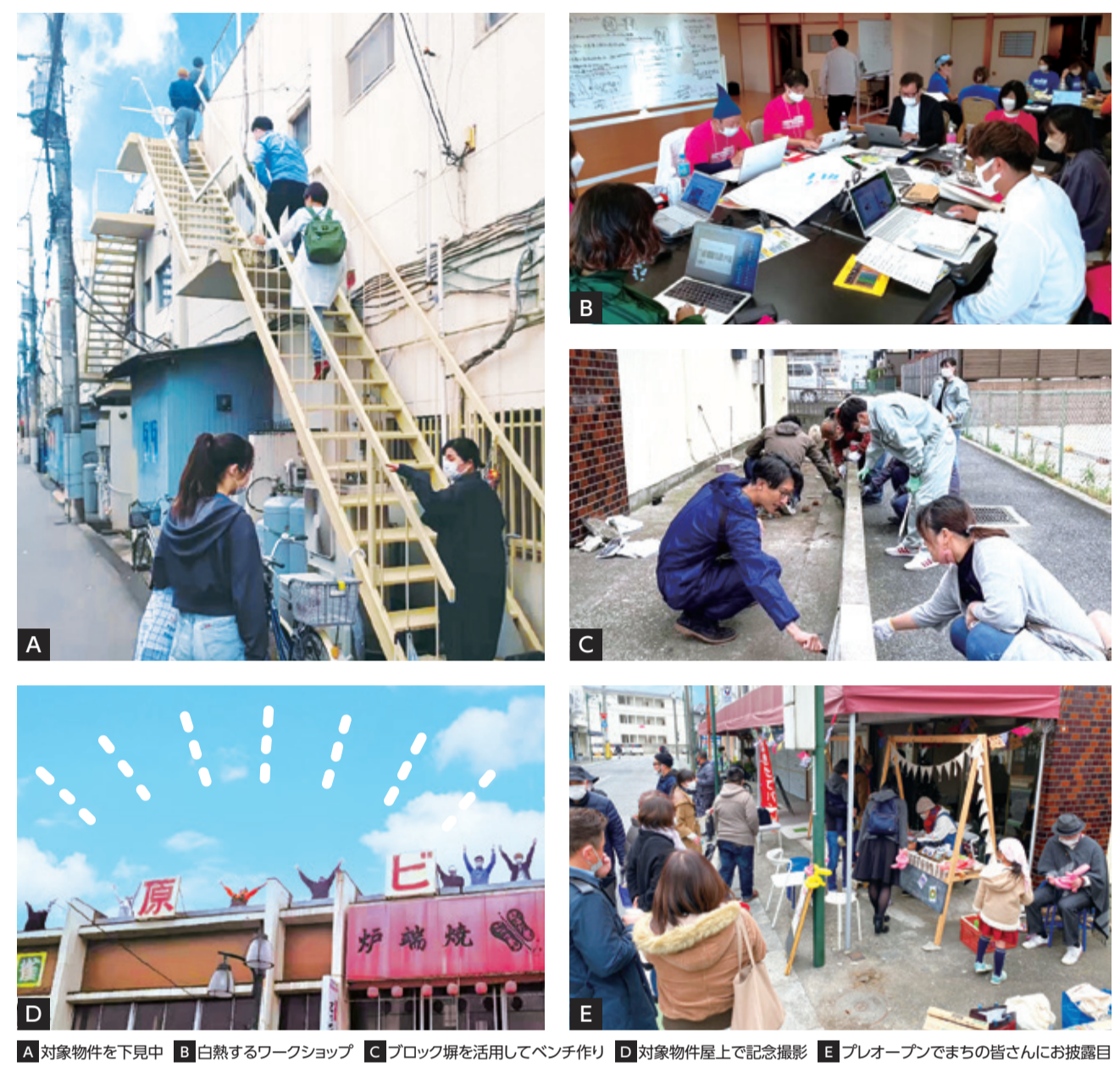
A 対象物件を下見中 B 白熱するワークショップ C ブロック塀を活用してベンチ作り D 対象物件屋上で記念撮影 E プレオープンでまちの皆さんにお披露目