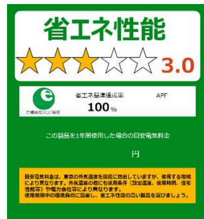
【統一省エネラベルの例】