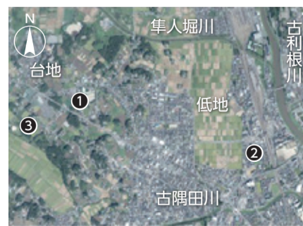
内牧地区(令和元年)