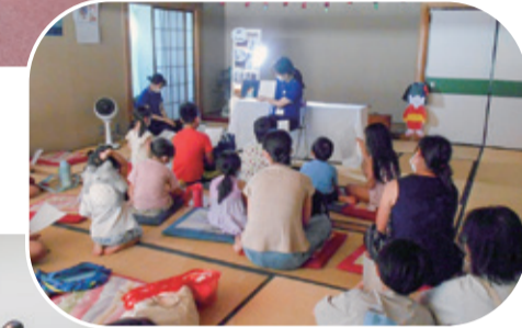
武里図書館「季節のおはなし会」