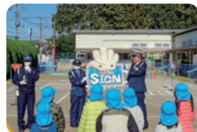
警察官にハンドサインを教わったよ