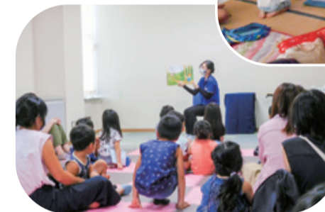
庄和図書館「夏休み親子おはなし会」