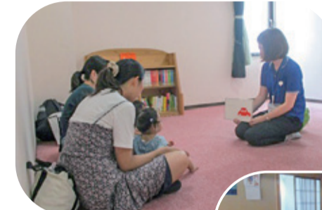
中央図書館「あかちゃんえほんの会」