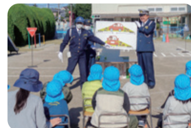
警察官の話聞いて交通安全のお勉強