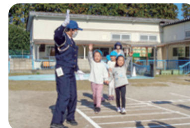
横断歩道を渡る練習をしたよ