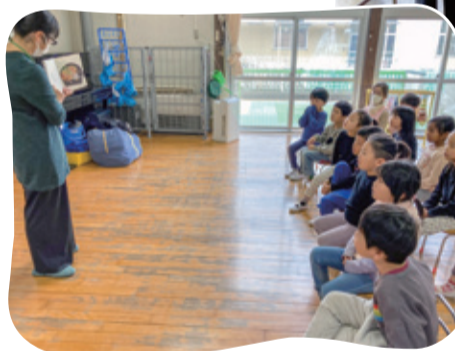
絵本「おやまごはん」の読み聞かせを行いました