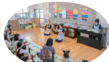
子育てルームでの楽しい「おあつまり」は、動作・表現・言語あそびです

親子保育と育児・子育て相談を週5日展開しています。子育て(親)と子育て(子)の両支援のため、さまざまなあそびの提供や、あそび方、関わり方、子を見る視点などの情報提供を寄り添いながら丁寧に行っています。気軽に参加してください。