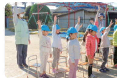
まっすぐ手を挙げる練習をしたよ