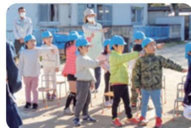
みんなで一緒に指さし確認

その後、横断歩道を渡る練習をしました。みんな、指さし確認をしっかり行い、信号も確認しながら緊張感を持って渡ることができました。