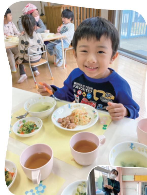
絵本の中に出てきた「おやまごはん」(チャーハン)を食べました

公立保育所(指定管理を除く)の給食では、毎月「絵本の献立」を実施しています。食べ物や食に関する絵本を給食の前に読み聞かせ、その絵本に登場する食べ物や料理を給食として提供します。食育の一環として食に関心を持ち、食べる楽しさや苦手な食べ物でも食べられる意欲を引き出す取り組みを行っています。