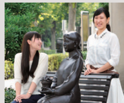
表紙の人:春日部育ちの「菓子工房 オークウッド」の従業員さんにご協力いただきました。

春日部がもっと好きになる、まちの情報誌 kasukabe+ 2015 SPRING/SUMMER