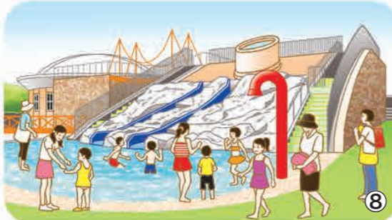
▲エンゼル・ドームでは、夏期期間に噴水(6月1日～9月30日)やスライダー(7月1日～8月31日)で水遊びができます。ドーム前広場では、ホビー、ヒマワリ、コスモスなど季節の花々を楽しむことができます。