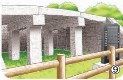
▼やじま橋。元文2年(1737)に、岩槻城主永井氏のために古隅田川にかかけられた県内でも最も古い石橋のひとつ。市指定有形文化財。