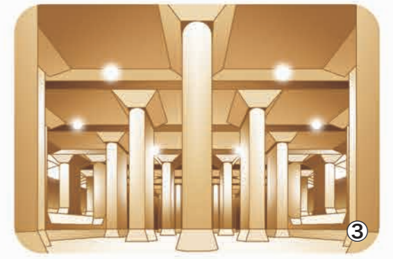
③ 首都圏外郭放水路の「地下神殿」と呼ばれる巨大な調圧水槽を見学できます。見学会は、無料・予約制。また、毎年11月の中旬には、彩龍の川まつり、首都圏外郭放水路特別見学会、江戸川カレッジ市が同時開催されます。