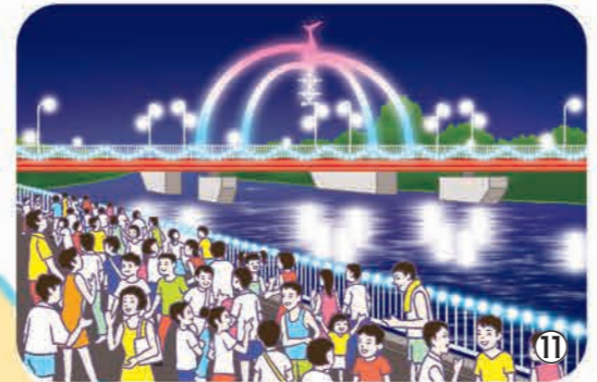
▲「夕涼みフェスタin公園橋」が毎年8月中旬に開催されます。ボート遊覧、カヤック体験、灯籠流しなどを楽しめるほか、夕暮れ時には川風にあたりながら、素敵な音楽をどうぞ。