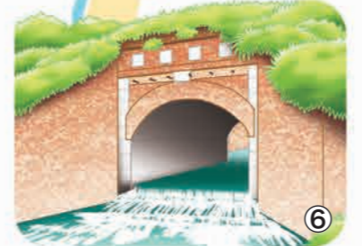
▼五ヶ門樋付中庄内樋管、排水機場跡。明治25年(1892)に作られたレンガ造りのアーチ型橋門。県指定有形文化財。