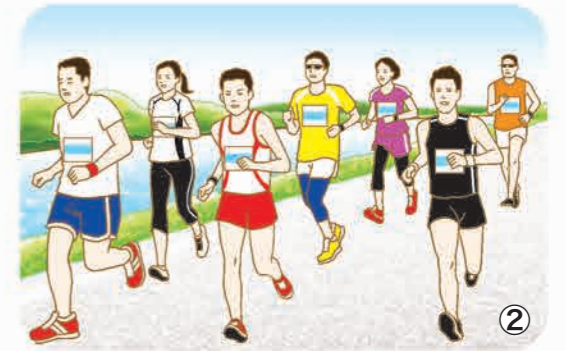
② 大岡マラソン大会。毎年5月4日、江戸川堤防沿いのコースで開催。種目は2K、5K、10K、ハーフがあり、小学4年生以上がエントリー可能です。