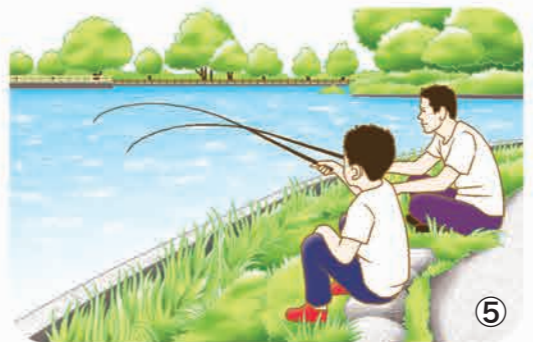
▼薬師沼親水公園の池の護岸は整備されていて、釣りを楽しむことができます。