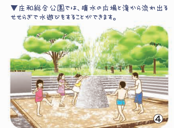
▼庄和総合公園では、噴水の広場と滝から流れ出るせせらぎで水遊びをすることができます。