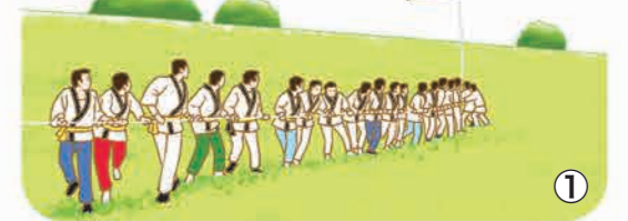
① 大岡あげ祭り。西宝珠花地先江戸川河川敷で、毎年5月3日、5日に開催。