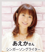
あえかさん シンガーソングライター