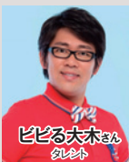
ビビの大木さん シネタ