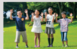
表紙の人:新市施行10年の平成27年10月1日、ちょうど10歳の誕生日を迎える市内の小学生4人に協力いただきました。

今回のテーマは「新市施行10年の歩み」です。旧春日部市と旧庄和町が合併して新しい春日部市が誕生したのは平成17年10月1日のこと。今号の表紙は、まさにその日に生まれた市内の小学校に通う子どもたちとそのご家族にご協力いただきました。子どもたちのあどけない笑顔と、子どもの様子をあたたくく見守るお父さん、お母さん、おじいちゃん、おばあちゃん、家族って本当にいいものですね。